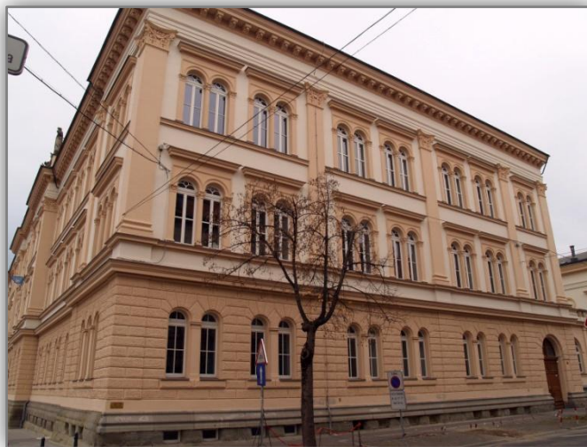
Stavba v Krekovi ulici, kjer je danes Prva gimnazija

S prihodom nemškega okupatorja je ravnatelj aprila 1941 moral predati šolo nemški civilni upravi, ki jo je uporabila za svoje potrebe. [3]