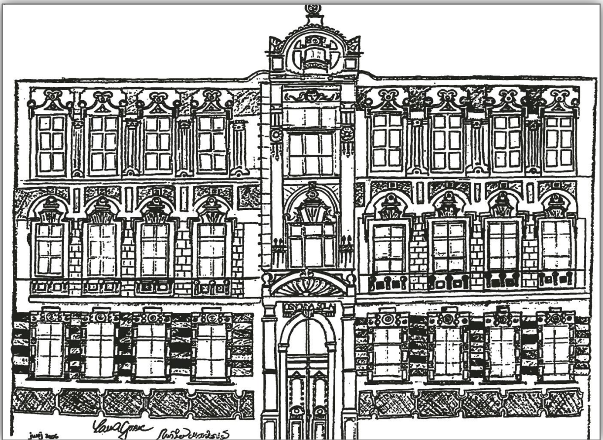
Lana Gorenc, učenka 9. c in Urška Markovič, učenka 9. b, 2006