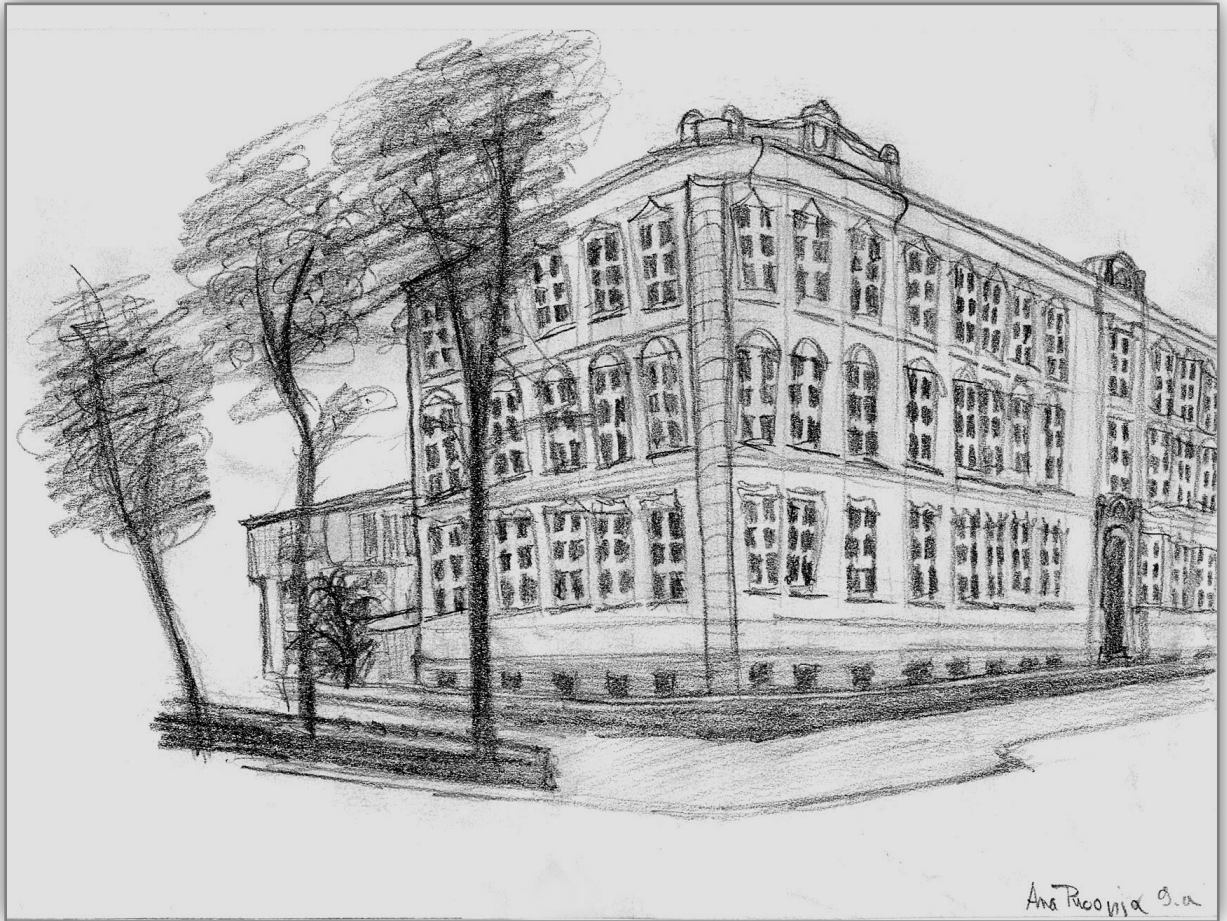
Ana Puconja, učenka 9. a, 2007