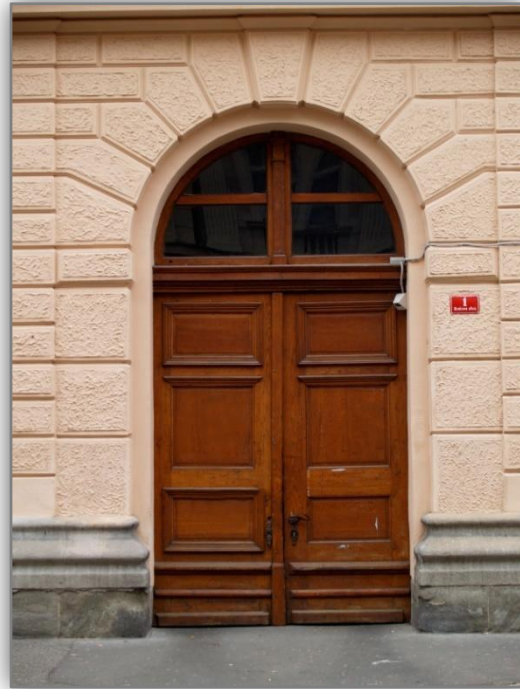
Vrata, skozi katera so vstopale generacije »Polančičev«