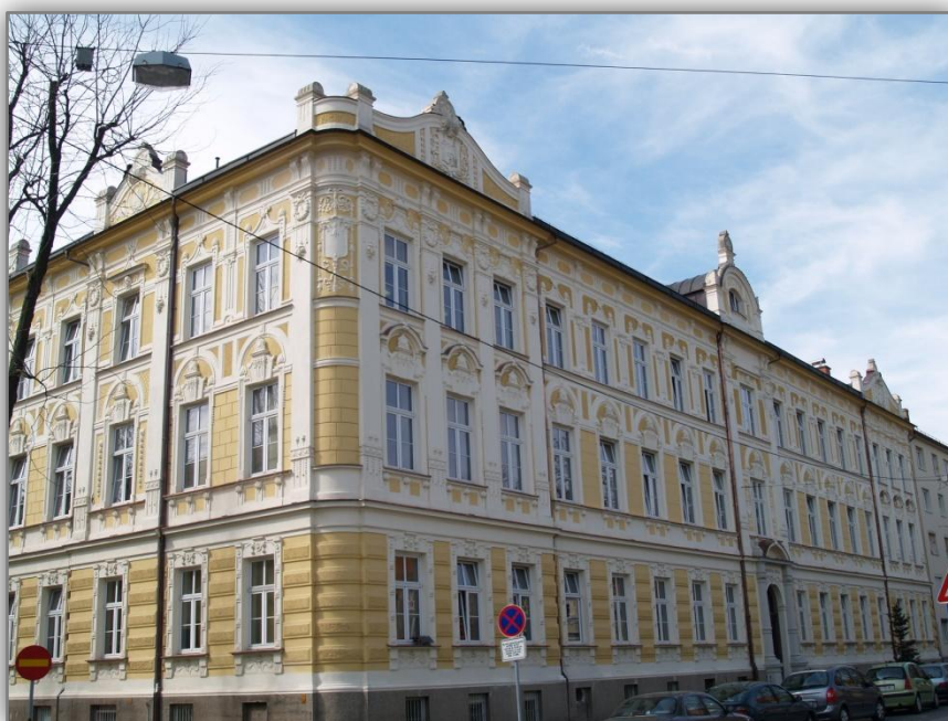
Stavba v Aškerčevi ulici

V šolskem letu 1959/60 se je šola preimenovala v Osnovno šolo bratov Polančičev. Imenovana brata sta bila nekoč učenca šole, ki ju je zaradi sodelovanja v osvobodilnem boju ubil nemški okupator. V šolskem letu 1971/72 so potekale priprave na združitev Osnovne šole bratov Polančičev in Osnovne šole Antona Aškerca. Šolsko leto 1972/73 sta združeni šoli pričeli delo pod imenom Osnovna šola bratov Polančičev. V stavbi v Krekovi ulici 1 so imeli pouk učenci od 5. do 8. razreda, v stavbi nekdanje osnovne šole Antona Aškerca v Aškerčevi ulici 6 pa učenci od 1. do 4. razreda. V šolo je bilo takrat vpisanih 696 učencev. [2]