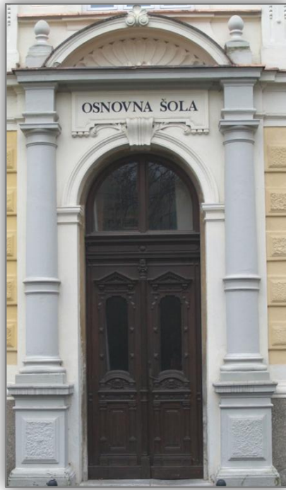
Vrata, skozi katera so vstopale generacije »Aškerčevcev«

V šolskem letu 2001/02 smo prvič vpisali učence v 1. razred devetletne osnovne šole in s tem odprli vrata devetletni osnovni šoli.