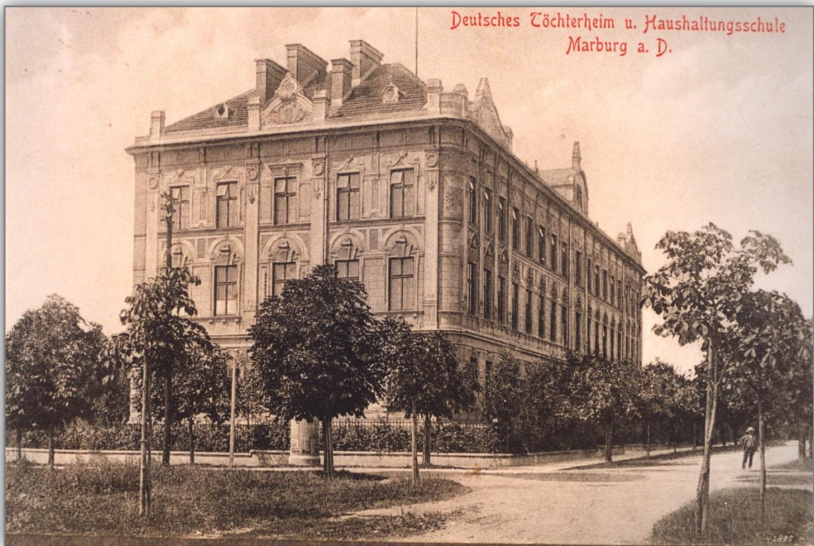
Šolska zgradba na Aškerčevi ulici, 1915